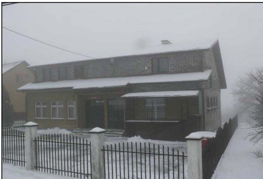
Budynek Wiejskiego Domu Kultury w Pawlikowicach