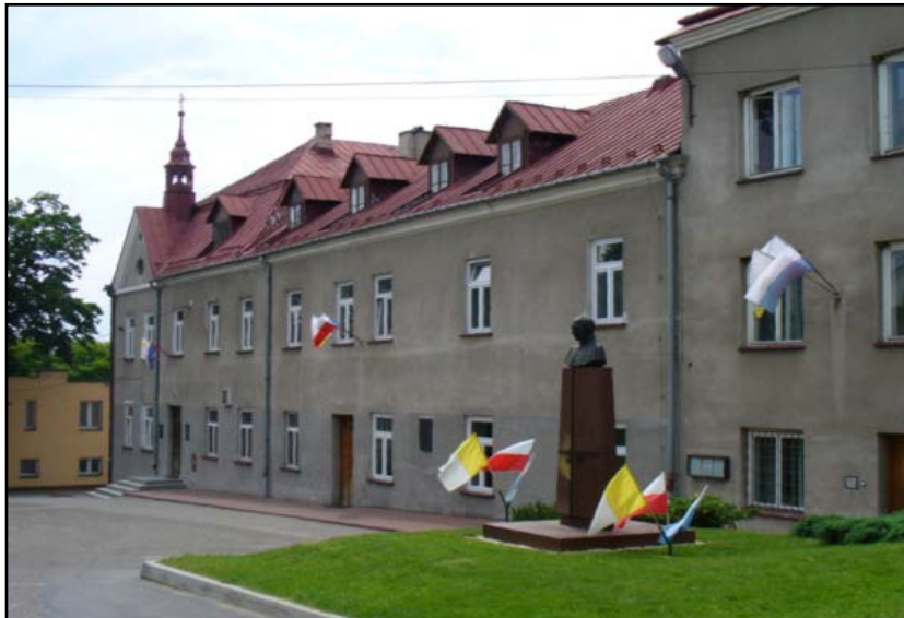
Kompleks budynków Księży Michalitów w Pawlikowicach