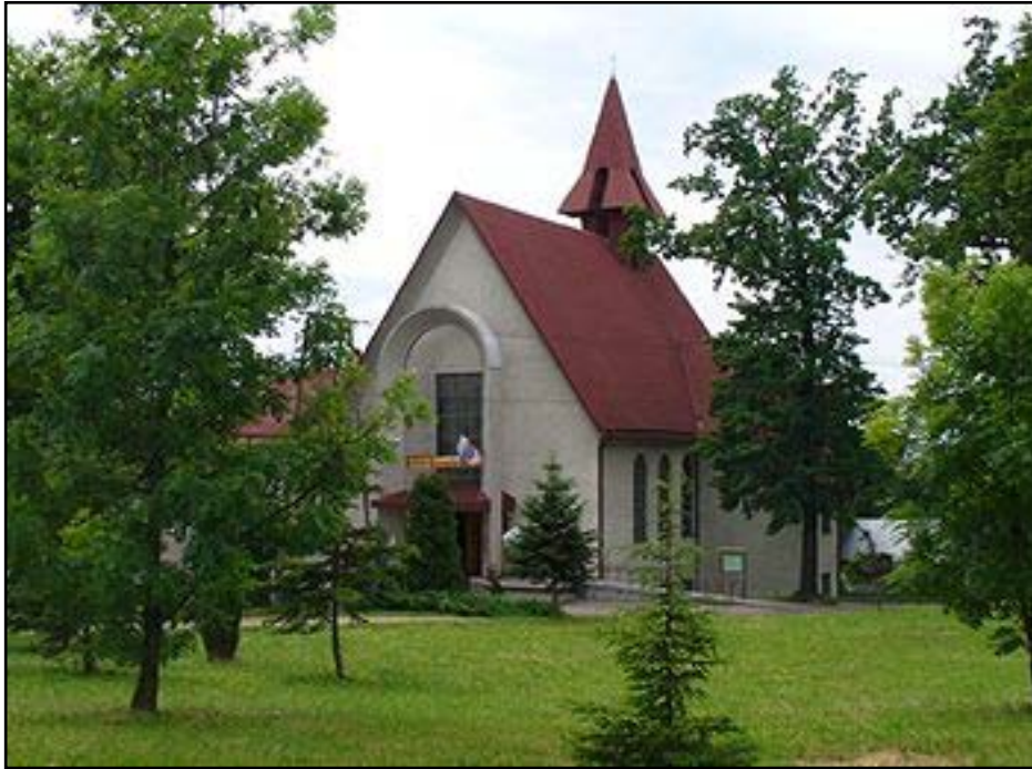
Kościół parafialny w Pawlikowicach